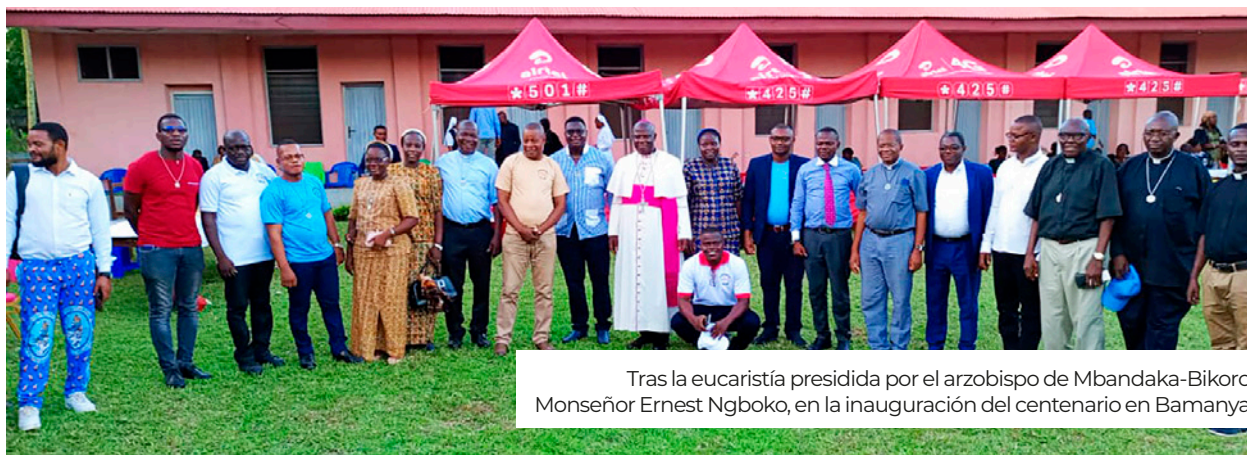
Tras la eucaristía presidida por el arzobispo de Mbandaka-Bikoro, Monseñor Ernest Ngboko, en la inauguración del centenario en Bamanya.

En 1961, su misión se separó del antiguo Vicariato de Coquilhatville. Como consecuencia, se convirtió en una diócesis autónoma con el doble nombre de Bokungu-Ikela.