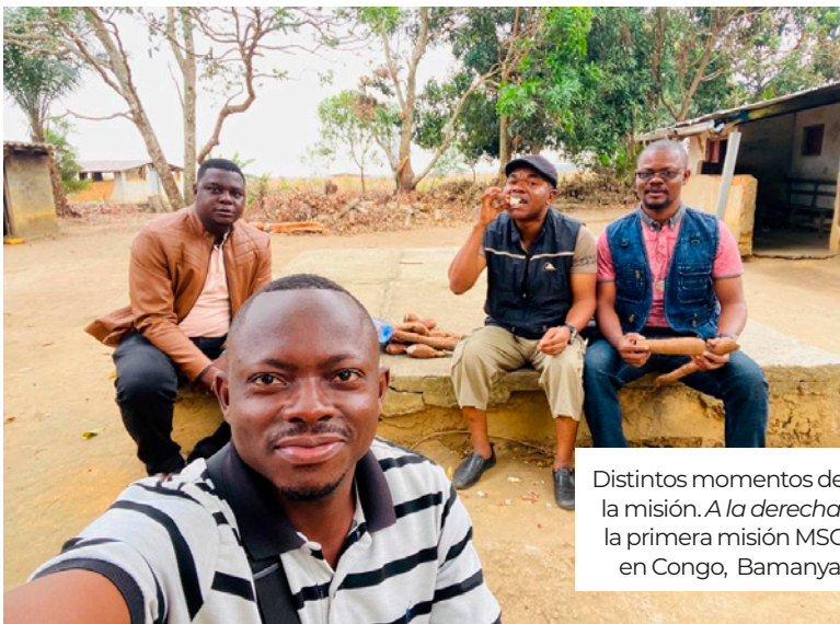
Distintos momentos de la misión. A la derecha , la primera misión MSC en Congo, Bamanya.